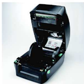
Moderní konstrukce a snadná obsluha

Tiskárna je určena pro lehké a středně těžké provozy. Reflektivní čidlo posuvné po celé šířce tiskové zóny umožňuje tisk na nejrůznější tvary etiket.