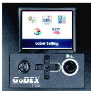
Moderní konstrukce a snadná obsluha

Termotransferové tiskárny RT700i jsou díky svému vybavení schopny dosahovat velmi vysokého výkonu Reflektivní čidlo posuvné po celé šířce tiskové zóny umožňuje tisk na nejrůznější tvary etiket.