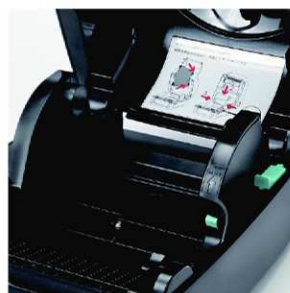
Bohyblivý držák etiket umožňuje snadné zakládání etiket