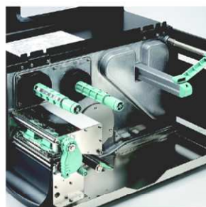
Kovový obal a tiskový mechanismus