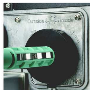
Použití navinu TTR pásek IN i OUT