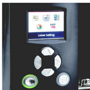
Barevný TFT displej pro snadné ovládání

Kovový tiskový mechanismus a obal předurčují tiskárny řady EZ2000i pro naročné aplikace s velkým objemem tisku