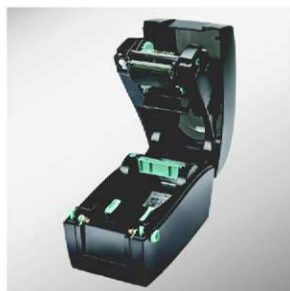
Snadné zakládání etiket a TTR pásky

Tiskárny řady RT200 jsou ideální tam kde je kladen důraz na kompaktní rozměry a nízkou cenu