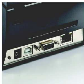
Ethernet, Serial a USB rozhraní