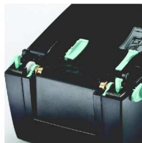
Senzor umožňují tisk na malé etikety